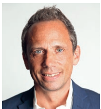
Thorsten Glauber, M.d.L. Bayerischer Staatsminister für Umwelt und Verbraucherschutz